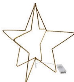
LED-Dekoration „Stern“ verstellbar, Ø 39 cm, mit 40 LED