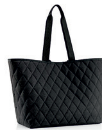
reisetel® classic shopper XL Design: rhombus black