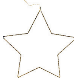
LED-Stern mit 225 oder 340 LED warmweiß, mit Timer, Ø 36 oder 60 cm