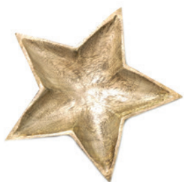
Schale „Stern“ aus Mango-Holz, Ø 16 cm