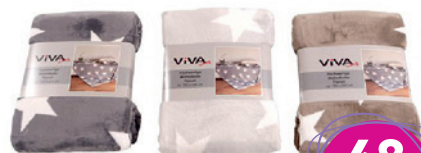
Wohndecke XL „Sterne“ 180 x 220 cm, verschiedene Farben