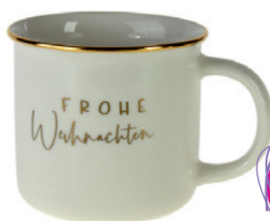
Tasse „Frohe Weihnachten“ weiß mit goldenen Details