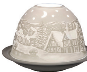
Dome Light „Winterzauber“ weiß, aus Biskuitporzellan