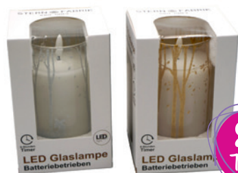
LED-Echtwachskerze „Elch“ im Glas, verschiedene Farben