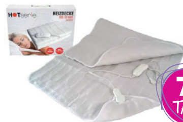
HOTserie® Heizdecke 150 x 80 cm, 3 Heizstufen, Überhitzungsschutz