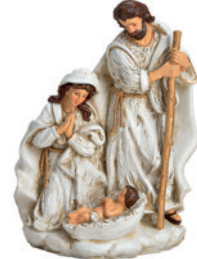
Krippenfigur „Heilige Familie“ 14 x 19 x 9 cm